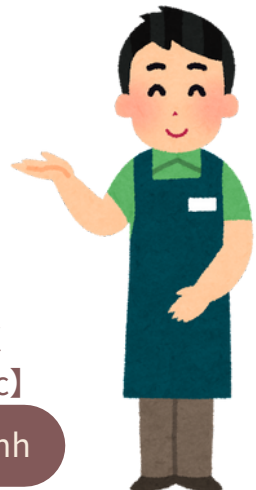
Anh C 【Thị thực】

Vì là học sinh nên em đang tham gia Bảo hiểm sức khỏe quốc dân và đang được miễn giảm học sinh của Lương hưu quốc dân. Với chế độ mới tiền bảo hiểm của em (Lương hưu quốc dân, Bảo hiểm sức khỏe quốc dân) sẽ thay đổi ra sao?