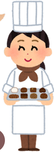
Chị A 【Thị thực】

Chồng tôi là du học sinh và tôi làm việc 28 giờ một tuần tại cửa hàng tiện lợi. Phí bảo hiểm của tôi sẽ thay đổi như thế nào với hệ thống này?