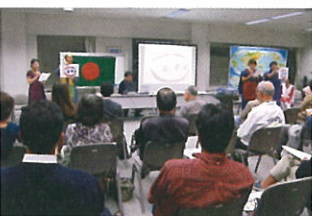
▲現場で行った歯みがき指導を再現中

JICA札幌では年5回、市民の皆様へ国際協力を身近に感じてもらうため、「国際協力市民セミナー」を開催しています。53回目の今回は草の根