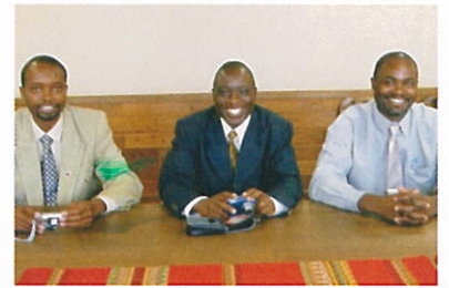
▲表敬訪問でこれからの研修に意欲満々のケニア勢。大型電機店まで歩いて行ったのはこの3名。早速購入したデジカメでパチリッ!

広い店内しかも品物の多さに喜びを感じ気持ちも高まり、日本製のは品質もよく宝の山を見た感覚でその日はデジカメを購入していました。何日か経ち「昨日、また大型電機店に行ってきた!」と話すのでどうやって行ったか聞いてみると「ちょっと小高いところから、煙突の煙が見えたんだ(パルプ工場の)。店はその近くにあったから、煙をめがけて歩いて行ったんだ。30分で着いたよ!早いだろ～、近道も発見したのさ!」さすがケニア人。目標物を決めて、そこに向かってひたすら歩く!実はバスに