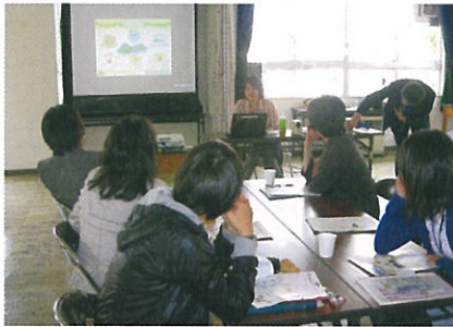
▲みんなで「ひょうたん島問題」を考える

9月19日(土)、開発教育/国際理解教育の導入編を函館で開催しました。開発教育を授業に取り入れたい教育関係者の方から国際情勢に視野を広げている学生達、ただただ興味のあるご近所方まで…様々な方々が参加されました。共にワークショップ等の体験を通じて世界の現状や課題について知り、話し合い、そして理解を深め、笑みある勉強会でした!!