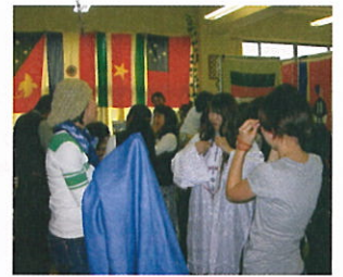
▲大盛況のJICAブース、身動きがとれません!

毎年、函館近郊で活動されている国際交流・国際協力団体が一丸となり、各団体の紹介を大々的に行う『第5回地球まつり』が、今年も10月4日(日)に開催されました。悪天候の中62団体が参加し、来客数は800名以上!JICA函館ブースは道南在住の協力隊OB・OGのパワーが集結!!民族衣装の試着と写真撮影、パネル・世界のお金・民芸品の展示、海外のお菓子&お茶など充実した内容でした。地域の方々との親睦、OB・OGの友情も深まり思い出に残る「地球まつり」となりました。