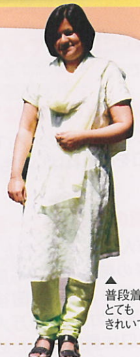
▲普段着? とてもきれいでした

もうひとつ驚いたのは、日本の研究者たちが朝から夜遅くまで仕事をしていること。「日本では普通なんでしょうが」。