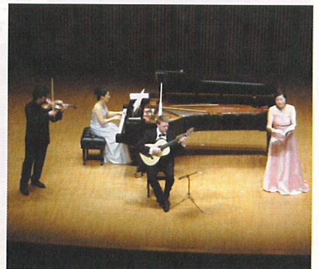
記念コンサート「北欧の魂を詩う」 (9月29日 札幌コンサートホール Kitara)