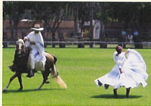
スペインの伝統を受け継ぐ優雅なダンス

近年、ペルーは自信を取り戻しています。経済は急速に成長し、マチュピチュの遺跡は「新・世界の七不思議1」に選ばれました。2008年5月には中南米－欧州サミット(LAC-EU)を開催し、11月には環太平洋諸国会議(APEC)が首都リマで開催されます。また、ペルー料理の人气が高まっています。ペルー料理に魅せられてやってくる観光客も多く、世界各地にペルー料理店がオープンしています。