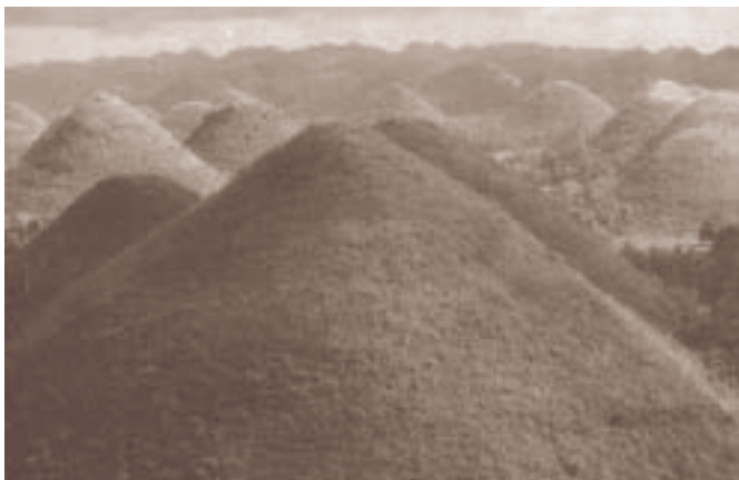
チョコレート・ヒルズ

島の面積は約4千平方キロで、本島と72の島々を持つ。人口はおよそ100万人。気候的には熱帯に属し雨期と乾期に分かれる。ボホール島では、世界の七不思議の一つとも言われる珍しい景色が見られる。「チョコレート・ヒルズ」といい、浸食作用によって形成された、お椀をふせたような丘が広がっている。木は生えていず、乾期になる